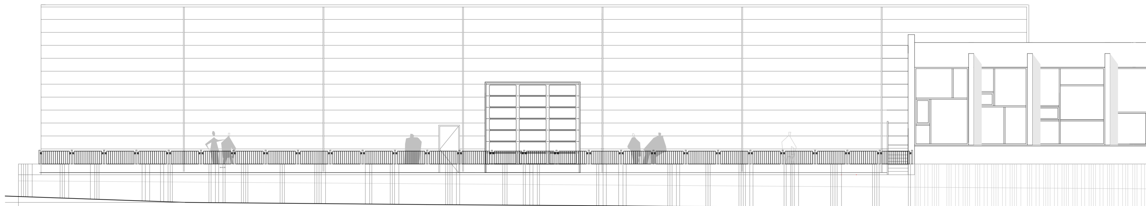
Stigahandrið útlit norður 1:100