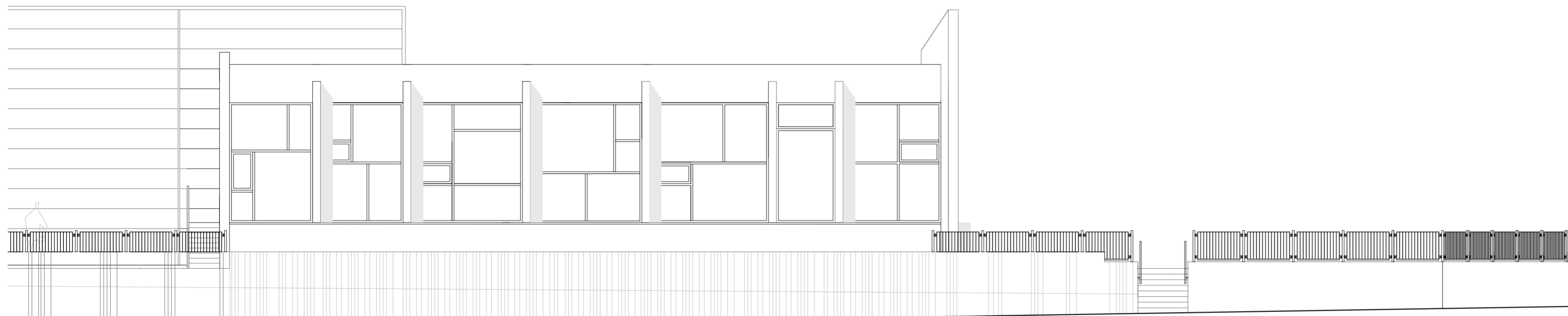
Stigahandrið útlit norður 1:100